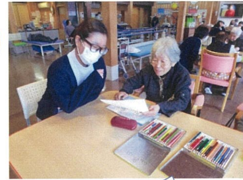
実習生と一緒にカレンダー作成