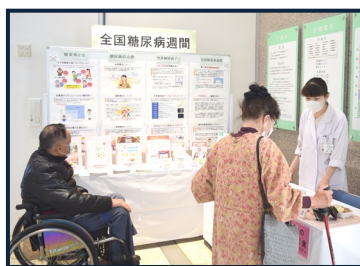
全国糖尿病週間 in 高梁中央病院

また、十一月十四日を含む一週間を「全国糖尿病週間」として、各都道府県糖尿病協会や友の会が主体となり、講演会や健康相談、街頭での広報活動などの地域単位での啓発活動が開催されています。当院でも十一月八日と九日に糖尿病を中心に生活習慣病に関する展示や、栄養士による食事相談を実施します。日々の食事に役立つカロリーゼ口、低カロリーの調味料などもご自由にお持ち帰りいただけます。お気軽にお立ち寄りください。